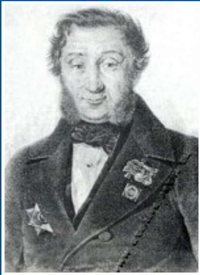
Илья Иванович Огарев